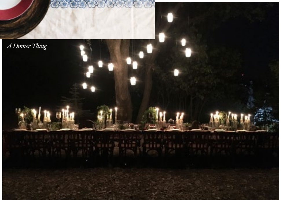
A Dinner Thing