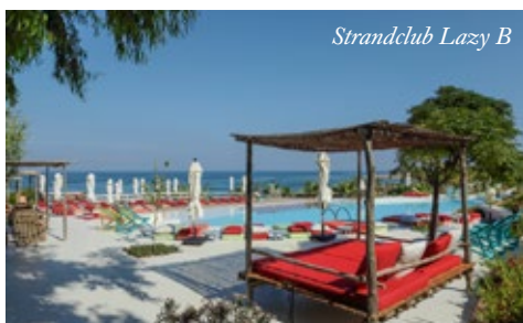
Strandclub Lazy B